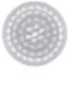
CEPILLO DE LIMPIEZA

NOTA: puede que su cepillo de limpieza facial True Glow® no incluya todos los accesorios disponibles. Para conseguir piezas adicionales o de repuesto, comuníquese con su detallista, llame al 1-800-3-CONAIR o visite www.trueglowbyconair.com